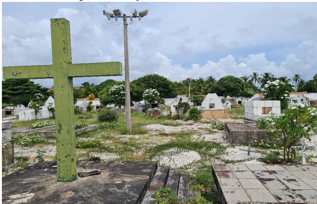
Figura 3. Condições internas do Cemitério.