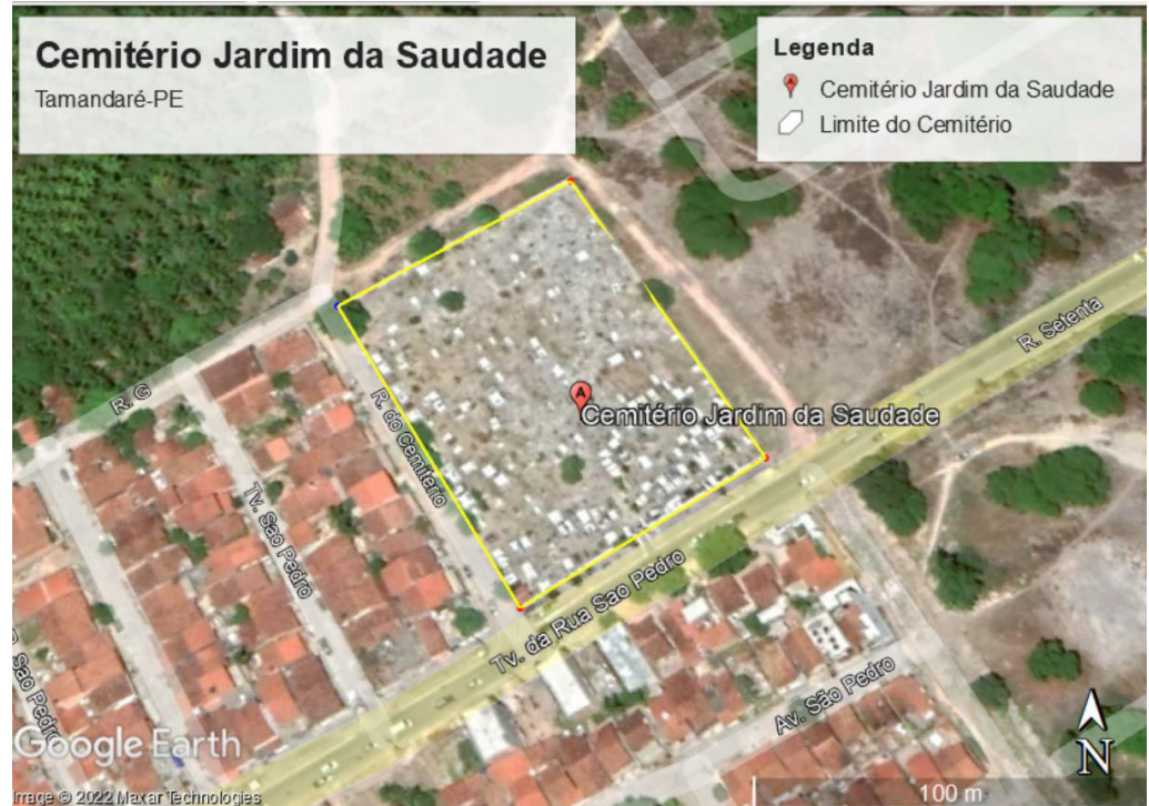
Figura 1. Cemitério Jardim da Saudade, Tamandaré/PE.

Os grãos de quartzo e feldspatos se apresentam de arredondados a subarredondados, bastante polidos, sugerindo transporte em meio subaquático (NEUMANN et al., 2013).