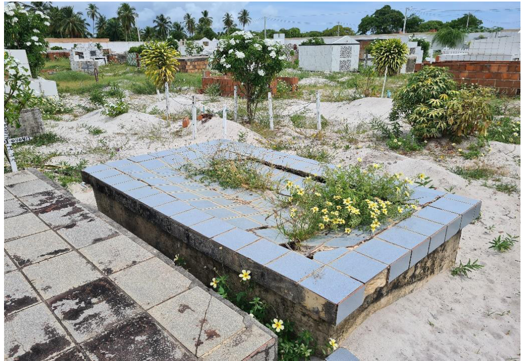
Figura 4. Falta de manutenção dos túmulos.